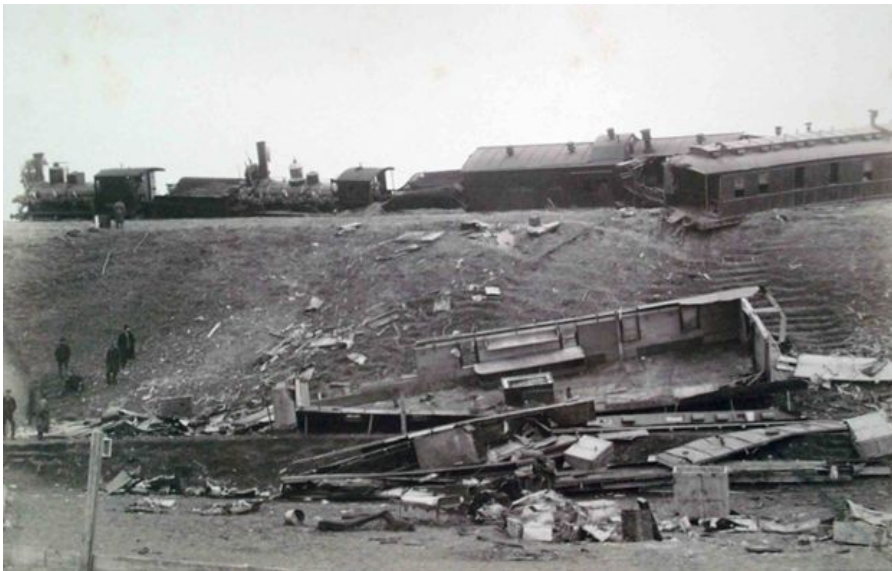
фотография А.М. Иваницкого

Задание 12. (ответ на данное задание оценивается в рамках Олимпиады школьников «В мир права» и одновременно в рамках Конкурса олимпиадных работ школьников на призы Следственного комитета Российской Федерации)